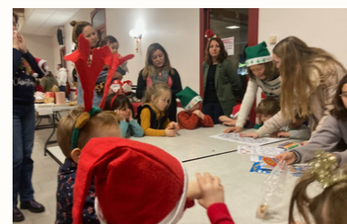
Fête de Noël des écoles 2024