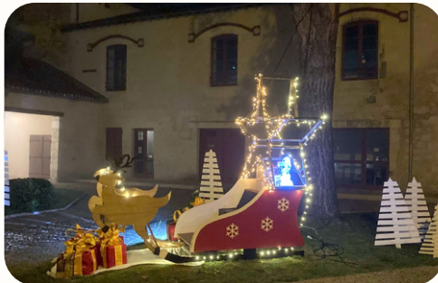
Illuminations 2024 - Comité des fêtes