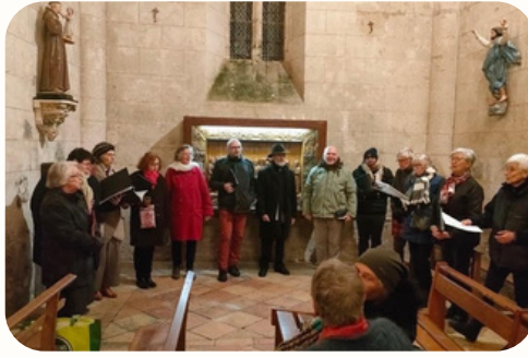
Animations Sonnaillies - déc. 2024