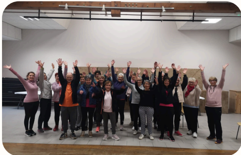
Gym douce 2024 - Cercle des fées mères