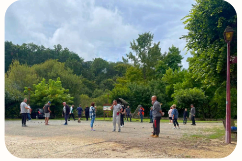
Concours de pétanque - sept. 2024