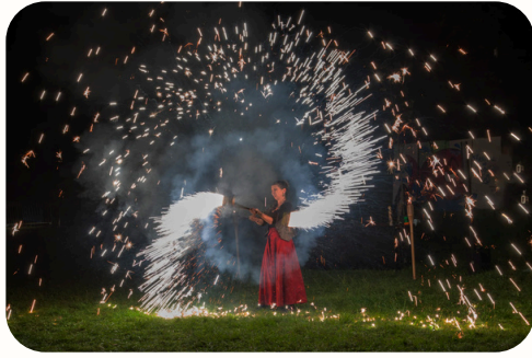
Festival de campagne 2024

INFORMATIONS MUNICIPALES N°9 - JANVIER 2025