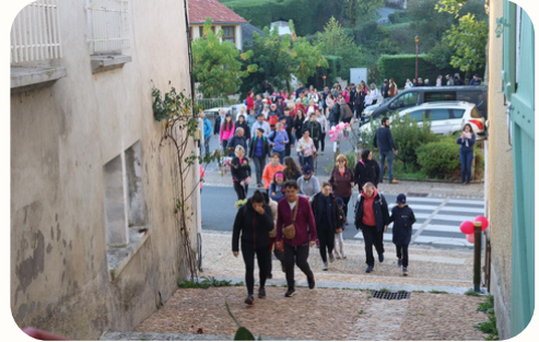
Octobre rose 2024 - Comité des Fêtes